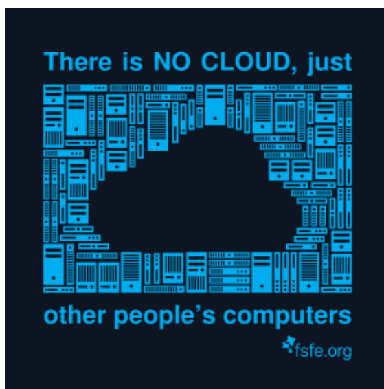
Image de nos ami-e-s de la FSFe

Comme Google Drive, Icloud et Microsoft OneDrive, tout le principe de Dropbox repose sur le degré de confiance qu'on peut accorder à une société (ici DropBox.Inc) dont les clauses d'utilisation peuvent être changées jusqu'à s'autoriser le scannage et l'usage des fichiers que vous leur confiez. Bien évidemment, personne (à part ces GAFAM) ne connaît le code des logiciels qu'ils utilisent, et donc personne d'autre qu'eux ne peut en vérifier les failles de sécurité (ou les portes dérobées). Enfin, les relations douteuses que peuvent entretenir de tels hébergeurs avec les autorités limitent grandement les droits universels à la vie privée et à la liberté d'expression, en particulier lorsque nos données sont hébergés aux USA, sous l'autorité étasunienne.