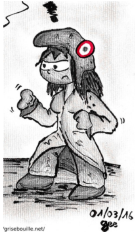
la Marianne de Gee n'est pas contente