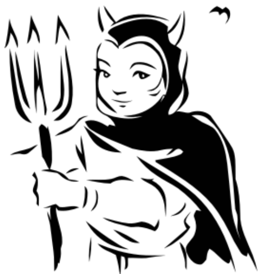
Devil girl by GDJ , Public Domain

Il y a quelque chose comme une raison dans l'histoire. Si ce n'est pas sous cette législature, tôt ou tard, le free software finira par s'imposer. Mais ce serait mieux maintenant.