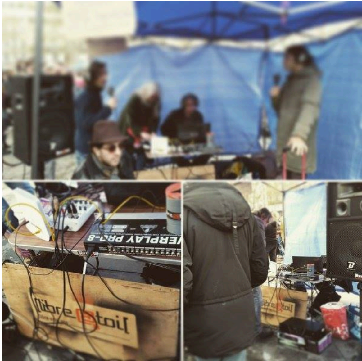
Stand de Libre@Toi*

Salut OliCat, même si à Framasoft on connaît bien Libre@Toi*, rappelle nous un peu qui tu es et ce que tu fais.