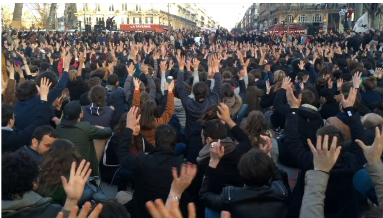
Séance de vote à Nuit Debout

Chez Framasoft on aime bien quand les gens utilisent nos services « Dégooglisons ». C'est pour ça que quand on a vu que le mouvement Nuit Debout utilise l'outil Framacarte et l'intégrer sur son site officiel notre première réaction ça a été : « Chouette ! ». Notre deuxième ça a été : « Et si on interviewait ce joyeux geek qui a repris la Framacarte pour lui demander ce qu'il en pense ? ».