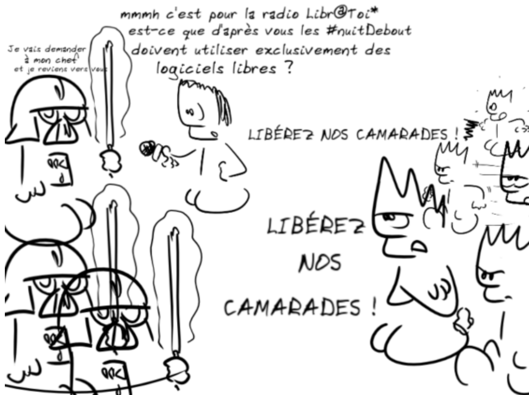
une interview sur le place de la République

Est-ce que vous profitez de votre présence place de la République pour sensibiliser les gens aux logiciels libres ? Est-ce qu'on vient vous en parler d'ailleurs ?