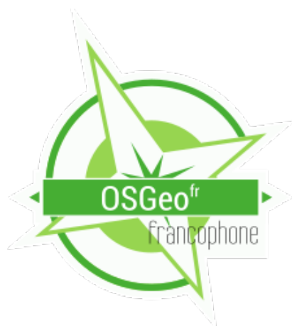
Logo OSgeo fr

L'OSGeo-fr est une association française qui est née il y a 10 ans pour donner de la visibilité aux logiciels libres en géographie (géomatique). Le fr c'est parce que nous sommes le « chapitre » (comme les loges maçonniques :-)) français d'une fondation internationale : http://www.osgeo.org/ .