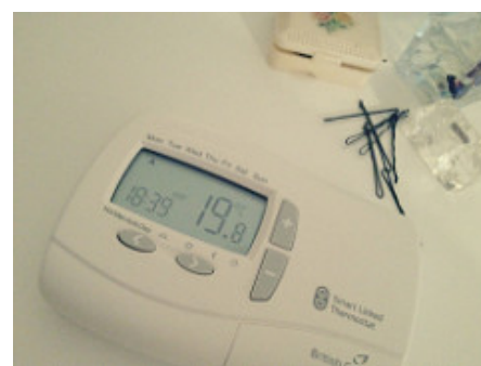
Thermostat connecté

Les menaces d'aujourd'hui incluent des hackers qui font s'écraser des avions en s'introduisant dans des réseaux informatiques, et qui désactivent à distance des voitures, qu'elles soient arrêtées et garées ou lancées à pleine vitesse sur une autoroute. Nous nous inquiétons à propos des manipulations de comptage des voix des machines de vote électronique, des canalisations d'eau gelées via des thermostats piratés, et de meurtre à distance au travers d'équipements médicaux piratés. Les possibilités sont à proprement parler infinies. L'internet des objets permettra des attaques que nous ne pouvons même pas imaginer.