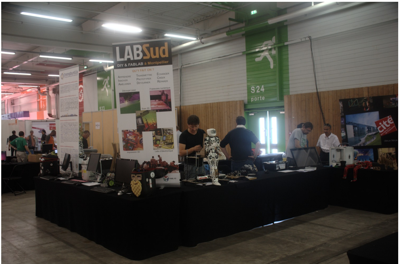
L'espace Logiciel Libre / Hackers / Fablabs de la fête de l'Huma 2015