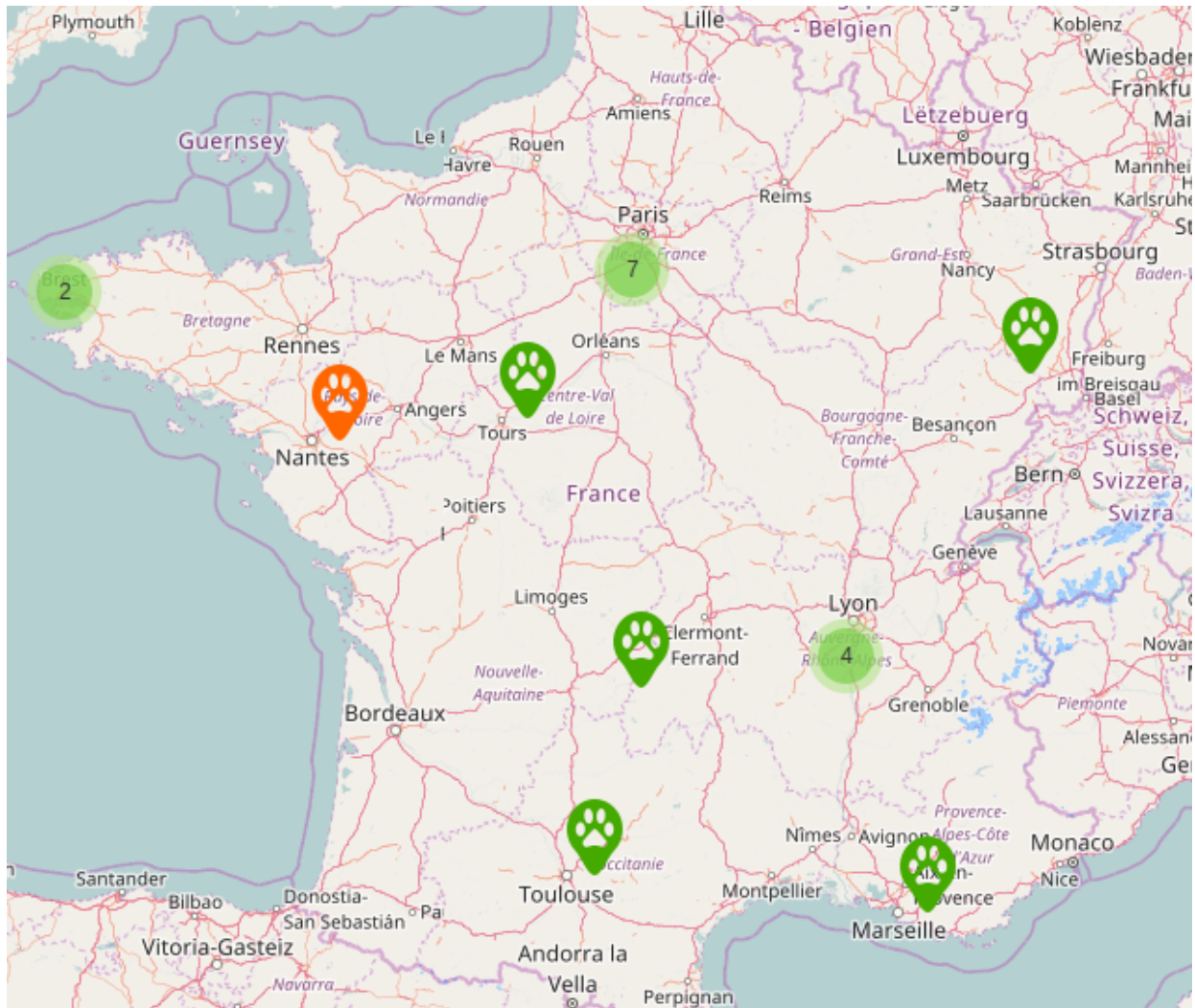
Un début de cartographie des chatons