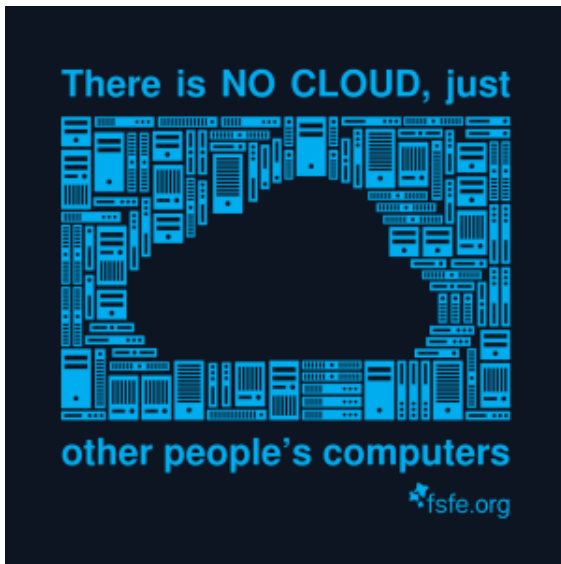
Image de nos ami-e-s de la FSFe

Mettre sur le cloud ses fichiers (icloud), ses emails (gmail), ses outils (Office365)... c'est les mettre sur l'ordinateur d'Apple, de Google, de Microsoft.