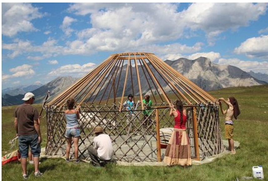
Montage d'une yourte, photo par Armel (CC BY SA 2.0)

d'administration pour le projet, mais la scission eut finalement lieu, le nouveau fork prenant le nom d'io.js. En février 2015 fut annoncée l'intention de créer une organisation 501(c) (6) en vue d'extraire Node.js de la mainmise de Joyent. Les communautés Node.js et io.js votèrent pour travailler ensemble sous l'égide de cette nouvelle entité, appelée la Fondation Node.js. La Fondation Node.js, structurée suivant les conseils de la Fondation Linux, dispose d'un certain nombre d'entreprises mécènes qui contribuent financièrement à son budget, notamment IBM, Microsoft et PayPal. Ces sponsors pensent retirer une certaine influence de leur soutien au développement d'un projet logiciel populaire qui fait avancer le web, et ils ont des ressources à mettre à disposition.