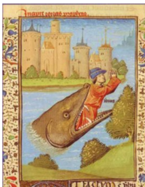
Jonas rejeté par la baleine.

Mais les services gouvernementaux ont toute latitude pour décider qui ils veulent ou non pirater avec des outils d'espionnage qui peuvent tout pister de leur cible : tous les appels téléphoniques, les textos, les courriels, les frappes au clavier, la localisation, chaque son et chaque image.