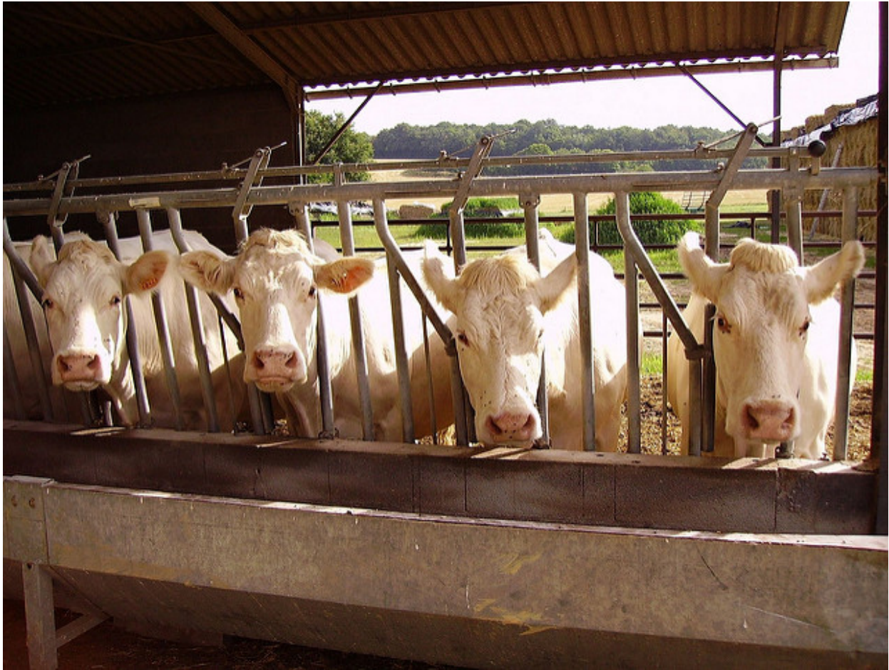
Vaches charolaises