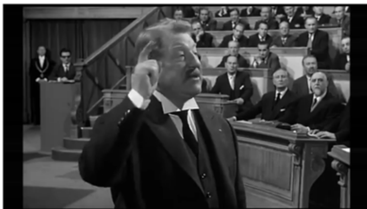
Dans le film d'Henri Verneuil le Président (1961), le vieux

Peut-être et surtout, il faut se blinder. Mon apprentissage politique, je l'ai commencé à l'Hadopi, je suis un peu tombée de mon arbre à ce moment-là et quand j'ai fait mes premiers pas à l'Assemblée Nationale, pour un UMP, on était à peine sorti de la guerre Copé-Fillon. Mine de rien, ça forge et j'avais une place d'autant plus privilégiée que je ne prenais pas les coups. Mais je voyais les autres en prendre et en donner. Alors, j'ai observé, j'ai regardé et j'ai appris.