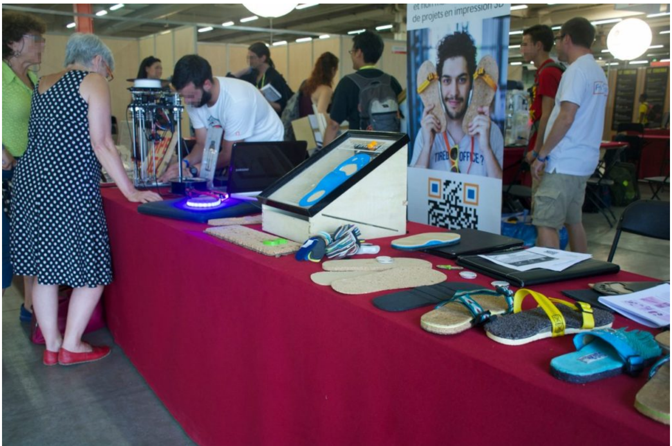
Stand Apedec/Ecodesign Fablab en 2016