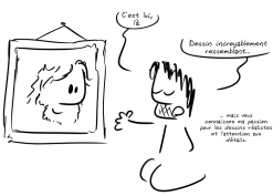
John P. Barlow

1) Né en 1917 dans le Wyoming, il étiquette sensiblement de son éducation mormone lorsqu'il découvre le LSD et devient parolier pour le groupe Grateful Dead.