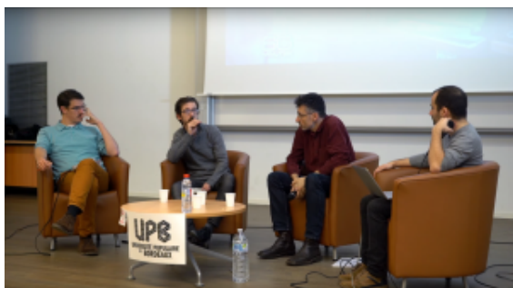
Capture d'écran du débat entre Pierre Carles et Usul

toute petite partie de notre activité. On pourrait dégager deux grands axes pour décrire les activités d'Aquilenet. Un premier axe est davantage centré sur les services. Au-delà des accès ADSL, l'association propose également des accès VPN (bon... c'est un accès à Internet en fait), des machines virtuelles, de l'espace de stockage, du mail ou encore de la VoIP. Nous sommes également parmi les fournisseurs de Brique Internet. Nous participons à différents projets comme The DCP Bay, de la distribution de films pour les salles de cinéma indépendantes. Tout ça repose bien entendu sur du logiciel libre et est garanti sans filtrage ! La seconde activité d'Aquilenet est plus d'ordre militant dans le sens où nous travaillons beaucoup à faire connaître la neutralité du net, le Libre ou à communiquer sur des thématiques dont nous nous sentons proches. Nous sommes impliqués localement pour sensibiliser sur ces thématiques et poussons pour un développement de l'Internet local plus accessible aux petites structures.