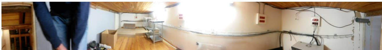
Data-center en tout début de construction

On l'a dit plusieurs fois depuis novembre, lors de nos réunions : c'est quelque chose d'important. Nous avons un lieu où nous nous rencontrons, de manière bien plus régulière et libre qu'auparavant. Depuis sa création, Aquilenet se rassemblait mensuellement dans un bar. Lorsque des ateliers avaient lieu, on faisait ça où l'on pouvait (souvent au Labx, hackerlab de Bordeaux). En cas de réunion, nous utilisions une salle... dans un bar, encore ! Maintenant, dès que quelqu'un veut travailler, dès qu'on veut discuter de quelque chose, débattre, préparer, planifier, faire un atelier : on se retrouve à « la Mezzanine », notre local. Il y a presque toujours quelqu'un de présent le mardi soir, toujours des petites réunions entre deux, trois, cinq, dix membres. Ça a donné une vraie existence physique à ce qui était, la majorité du temps, des appels, SMS, emails, échanges sur IRC.