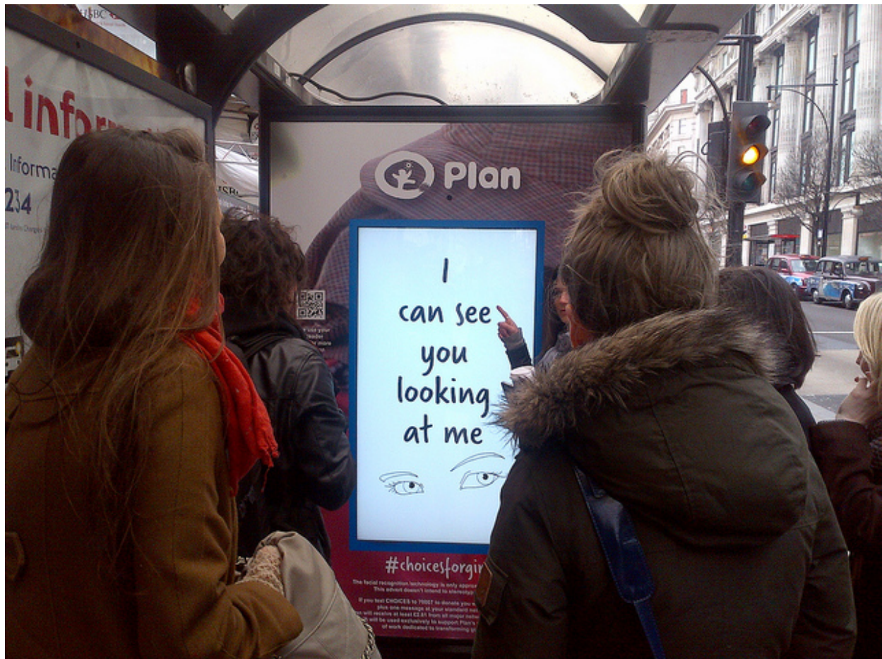
« Je te vois me regarder » (Londres, 2012)