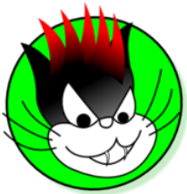
Avatar de Clochix

Remarque liminaire : je préfère parler plutôt d' intimité que de vie privée. On a parfois l'impression que la vie privée ne concerne que les personnes publiques ou les gens qui ont des choses à cacher. En parlant d'intimité, j'espère que davantage de gens se sentent concerné·e·s.