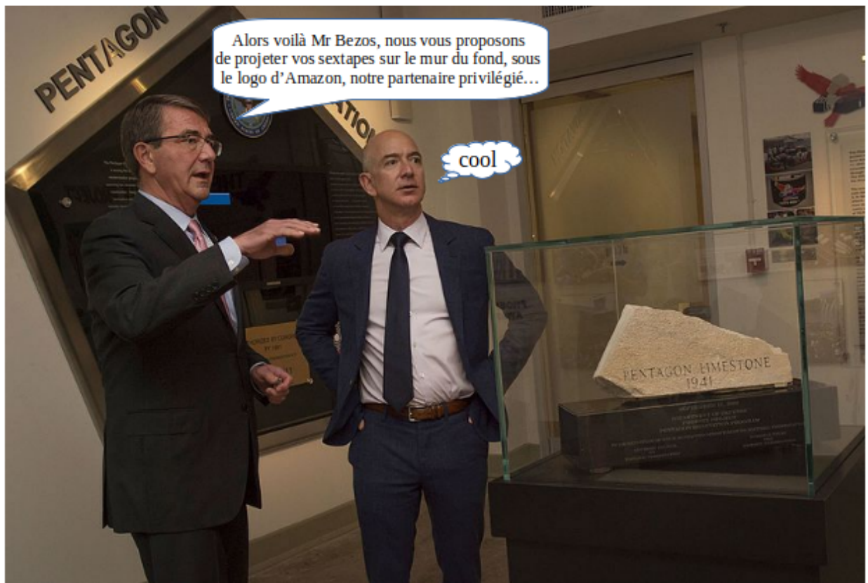
Jeff Bezos prépare le vernissage de l'exposition « Pentagone et confidentialité »