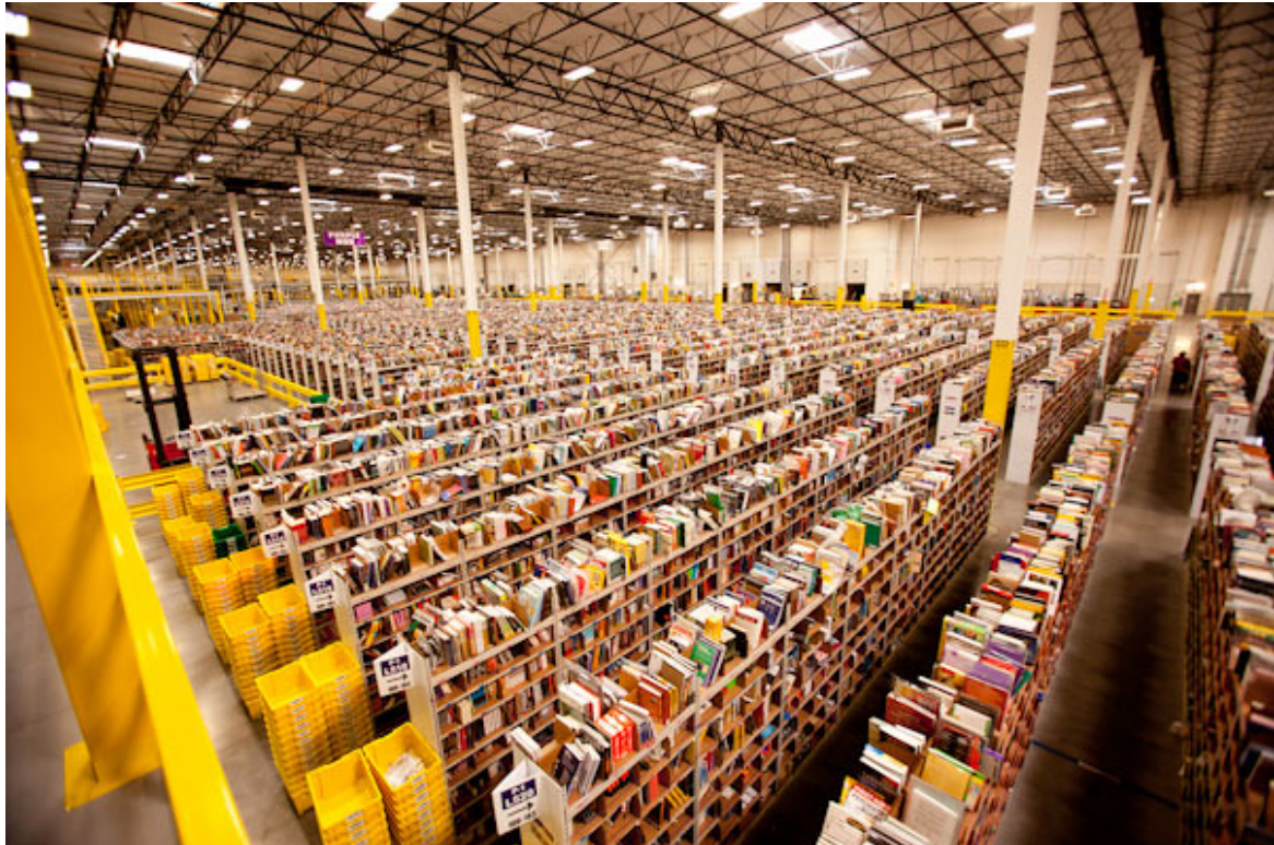
Un entrepôt d'Amazon, photo par Scott Lewis (CC BY 2.0)

Cependant, vu de l'extérieur, on a l'impression que les entrepôts Amazon mettent en scène le « taylorisme sauvage ». Comme je l'ai déjà écrit, le taylorisme est une théorie de la gestion de l'ingénierie développée au début du XX e siècle et largement adoptée dans les domaines de la gestion et de l'ingénierie jusqu'à présent. Alors qu'à l'origine il était utilisé pour gérer les processus de fabrication et se concentrait sur l'efficacité de l'organisation, avec le temps, le taylorisme s'est intégré dans la culture d'ingénierie et de gestion. Avec l'avènement des outils de calcul pour la mesure quantitative et les métriques et le développement de l'apprentissage machine basé sur les mégadonnées développées par ces métriques, les entreprises dont Amazon, ont abordé une nouvelle phase que j'appellerais « l'analyse extrême des données », dans laquelle tout et quiconque peut être mesuré finit par l'être.