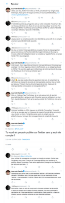
capture d'écran, discussion avec L. Chemla sur Twitter.

Il est donc cohérent d'affirmer que - pour pouvoir écrire à un utilisateur de Messenger depuis un autre outil - il faut avoir soi-même un compte Messenger. Il est donc logique de dire que pour pouvoir lire ma timeline Twitter avec l'outil de mon choix, je dois avoir un compte Twitter. Il est donc évident que pour accéder à mon historique d'achat Amazon, je dois avoir un compte Amazon, etc.