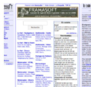
Framasoft.net, l'ancêtre de Framasoft.org

Ses rapports avec le monde de l'éducation sont alors encore très forts : l'association est principalement composée d'enseignants ou de personnes proches du monde éducatif, le site est hébergé gracieusement pendant plusieurs années par le Centre de Ressources Informatique de Haute-Savoie (CRI74), les relations avec le pôle logiciels libres du SCÉRÉN 2 sont au beau fixe, les enseignants s'emparent du libre et créent de multiples associations (ABULEdu 3 , Sésamath 4 , Scidérale 5 , etc.). C'est une période extrêmement riche et foisonnante pour le libre à l'école. Évidemment, les solutions de Microsoft sont omniprésentes dans les établissements, et les victoires des partisans du logiciel libre sont rares. Mais il n'en demeure pas moins que la marge de manœuvre laissée aux enseignants est grande, et que les sujets du libre à l'école, des Ressources Éducatives Libres, des licences Creative Commons, etc. ne sont certes pas soutenus par l'institution, mais pas freinés non plus.