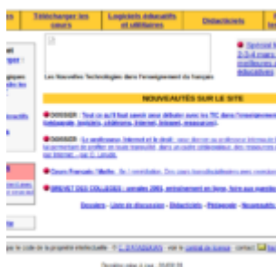
Framanet, l'aïeul de l'ancêtre de Framasoft