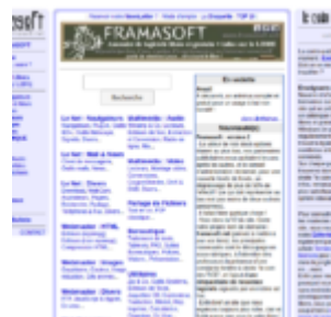
Framasoft.net, l'ancêtre de Framasoft.org