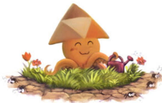
Illustration de David Revoy (CC-BY)

Prenez par exemple l'instance https://skeptikon.fr/about/instance : 2 400 utilisateur·ices, mais « seulement » 838 vidéos. Par contre, ces vidéos sont toutes sur une même thématique : « la zététique, l'esprit critique et le scepticisme de manière plus générale. ». Plus intéressant encore, cette instance est gérée par une association dédiée, qui est financée par les dons. Cela permet à des vidéastes de différentes tailles de pouvoir diffuser leurs vidéos hors de Youtube, tout en conservant un coût raisonnable. C'est un modèle intéressant, car si par exemple un telle association compte 30 vidéastes, payant chacun 24€ par an (soit 2€ par mois dans cet exemple), cela permet de financer un gros serveur dédié et de ne pas être limité par l'espace disque. Il faut « juste » trouver du monde pour faire collectif, ce qui n'est pas simple, mais permet aussi de construire de faire-ensemble.