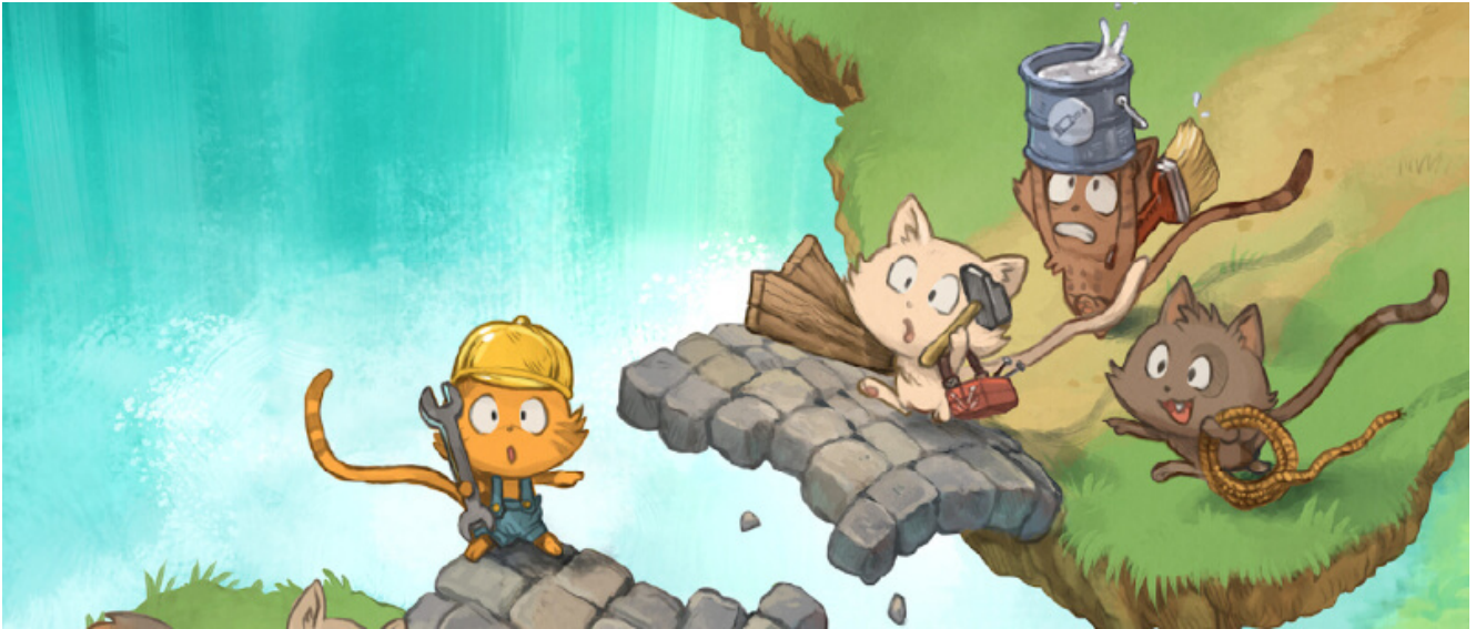
Illustration CC By David Revoy (sources)

Framasoft est une association française de loi de 1901 à but non lucratif reconnue d'intérêt général . Ainsi, les dons effectués à Framasoft sont déductibles des impôts : un don de 100 € vous coûtera 34 € après défiscalisation (si vous êtes imposable en France).