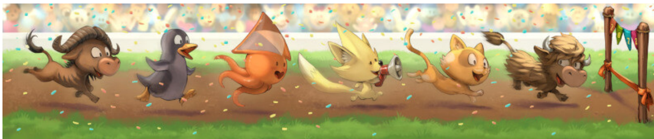
Illustration CC By David Revoy (sources)

Des envies de projets, d'actions et de réflexions, en général on en a beaucoup ! On vous explique tout en détail dans cet article publié sur le Framablog. Et on vous en fait un (bref) récap ici, parce que toutes ces choses qu'on voudrait faire, si elles se réalisent, ce sera bien grâce à vous !