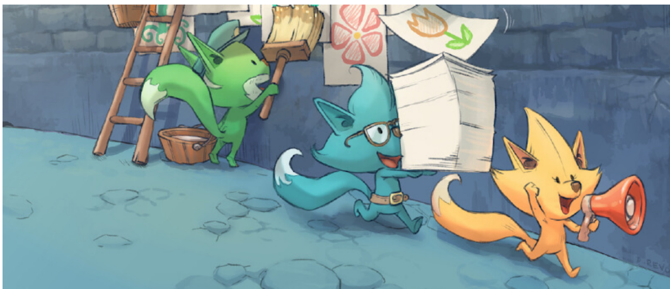
Illustration CC By David Revoy (sources)

Mobilizon est un outil fédéré vous proposant une alternative aux groupes et pages Facebook, en respectant votre attention, votre autonomie et vos libertés .