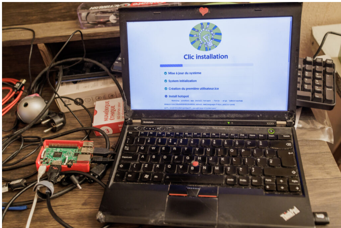
L'interface d'installation de CLIC!