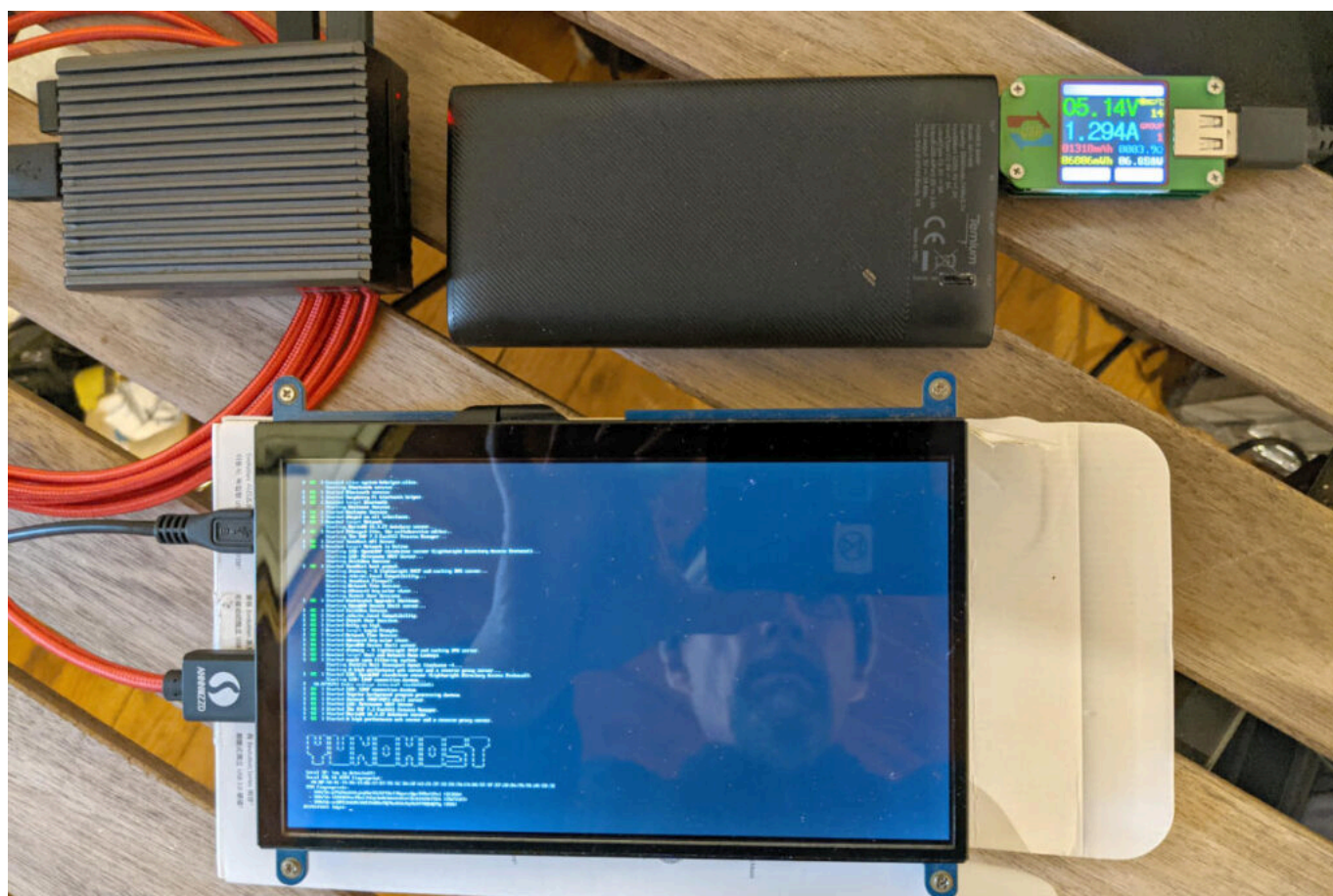
12b prend des mesures d'un Raspberry Pi sur batterie, avec un écran portable branché.

Une caractéristique importante des batteries est la puissance maximale qu'elles peuvent absorber quand on les charge. C'est ce qui permettra de déterminer s'il est possible de les recharger en une seule journée via un panneau solaire ou s'il faudra compter plusieurs jours de soleil pour une charge complète.