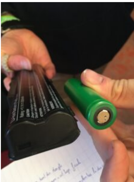
Les piles lithium rondes que l'on peut trouver dans les batteries d'ordinateurs portables

Un beau travail a été mené pour détailler les opérations nécessaires pour récupérer des batteries depuis des vieilles batteries d'ordinateurs portables. Toutes les opérations sont détaillées dans un tutoriel accessible sur le wiki du Distrilab.