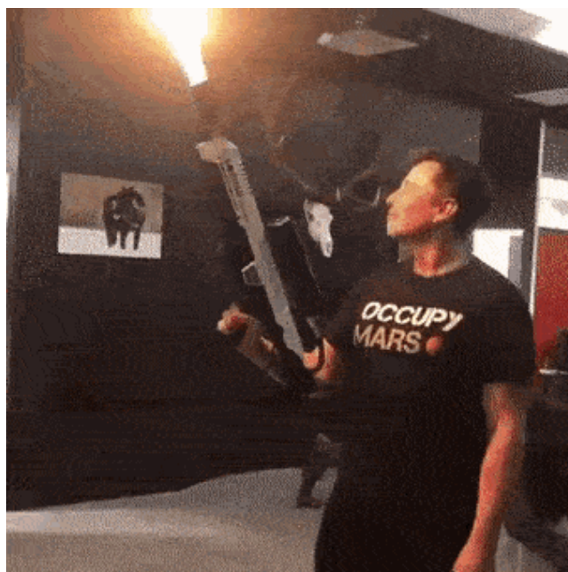
Elon Musk jouant avec nos attentions (allégorie).

Que ce rachat de Twitter par le milliardaire conservateur se finalise ou non, au final peu importe : le danger a toujours été là.