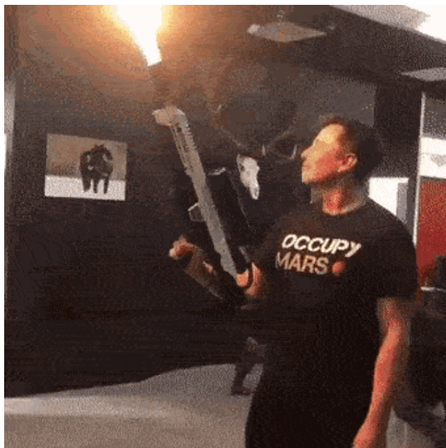
Elon Musk jouant avec nos attentions (allégorie).

Que ce rachat de Twitter par le milliardaire conservateur se finalise ou non, au final peu importe : le danger a toujours été là.