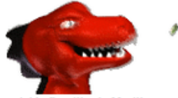
L'insatiable Bugzilla de Mozilla

travaillant sur ces trois problèmes basiques. Et je suis vraiment excitée à l'idée de travailler sur des problèmes encore plus difficiles et d'augmenter ma compréhension de ce sujet et mes connaissances.