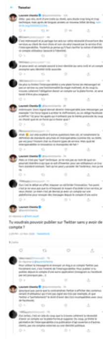
capture d'écran, discussion avec L. Chemla sur Twitter.

Il est donc cohérent d'affirmer que - pour pouvoir écrire à un utilisateur de Messenger depuis un autre outil - il faut avoir soi-même un compte Messenger. Il est donc logique de dire que pour pouvoir lire ma timeline Twitter avec l'outil de mon choix, je dois avoir un compte Twitter. Il est donc évident que pour accéder à mon historique d'achat Amazon, je dois avoir un compte Amazon, etc.