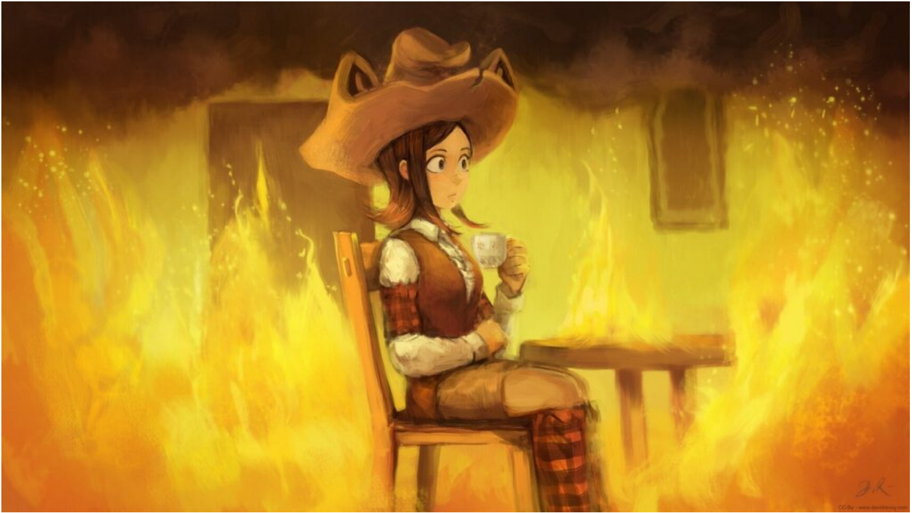
Image d'illustration : « This is not fine », licence CC-BY 4.0, source en haute résolution disponible

« C'est cool, vous avez utilisé quel IA pour faire ça ? »