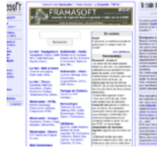
Framasoft.net, l'ancêtre de Framasoft.org

Ses rapports avec le monde de l'éducation sont alors encore très forts : l'association est principalement composée d'enseignants ou de personnes proches du monde éducatif, le site est hébergé gracieusement pendant plusieurs années par le Centre de Ressources Informatique de Haute-Savoie (CRI74), les relations avec le pôle logiciels libres du SCÉRÉN 2 sont au beau fixe, les enseignants s'emparent du libre et créent de multiples associations (ABULEdu 3 , Sésamath 4 , Scidérale 5 , etc.). C'est une période extrêmement riche et foisonnante pour le libre à l'école. Évidemment, les solutions de Microsoft sont omniprésentes dans les établissements, et les victoires des partisans du logiciel libre sont rares. Mais il n'en demeure pas moins que la marge de manœuvre laissée aux enseignants est grande, et que les sujets du libre à l'école, des Ressources Éducatives Libres, des licences Creative Commons, etc. ne sont certes pas soutenus par l'institution, mais pas freinés non plus.