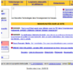
Framanet, l'aïeul de l'ancêtre de Framasoft