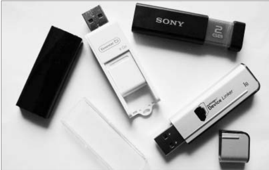
Baisse des prix et augmentation des capacités sont les tendances lourdes du marché des clés USB.

Ces derniers mois, les performances des clés USB ont tellement progressé qu'elles ouvrent de nouvelles perspectives : pourquoi encombrer son portable d'un lecteur-graveur, voire pourquoi s'encombrer d'un portable ?