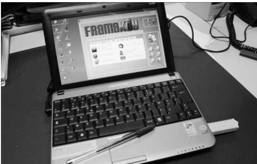
Avec 80 Go de mémoire, le Medion E1210 corrige le « défaut » des Asus EeePC. Mais il est plus cher.

Les ordinateurs portables à moins de 400 € font fureur. L'Allemand Medion avec son E1210 vient concurrencer Asus est ses EeePC avec un argument de poids : un disque dur de 80 Go.