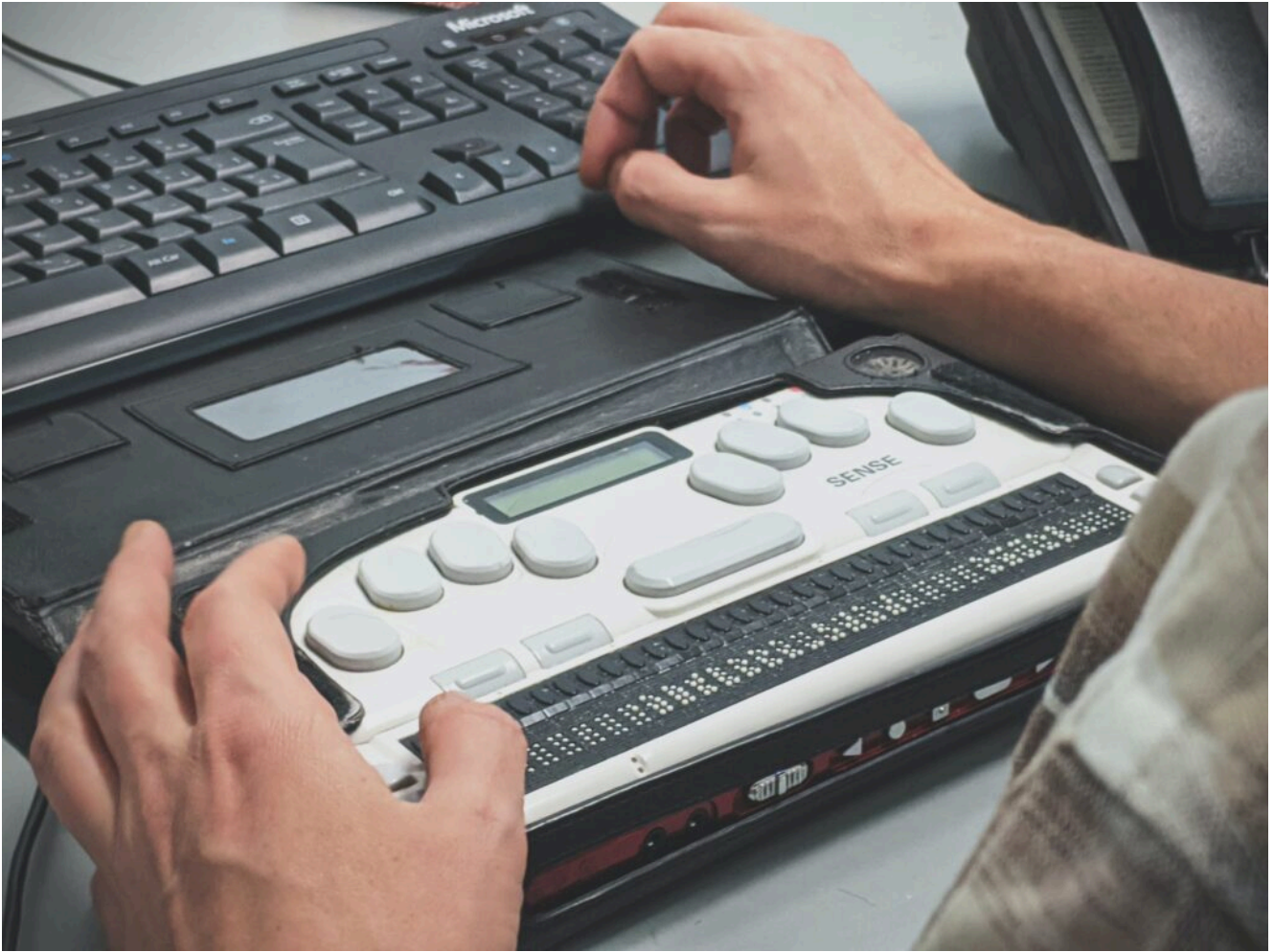
Un lecteur braille

Il y a également un autre paradoxe : la plupart des logiciels libres populaires dédient une partie de leur documentation à l'accessibilité, chacun expliquant comment les logiciels sont accessibles. Nous reconnaissons les efforts faits pour améliorer la situation, pourtant, en regardant les cas de OnlyOffice et de Mattermost, nous regrettons :