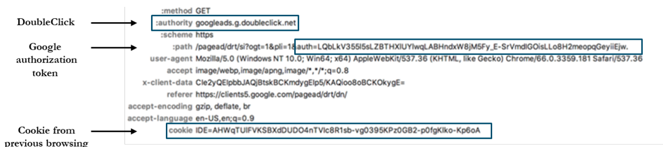
Figure 11 : La requête à DoubleClick.net inclut le jeton d'authentification Google et les cookies passés.

55. Dans la dernière étape de ce processus de connexion, une requête est envoyée au domaine DoubleClick. Cette requête contient à la fois le jeton d'authentification fourni par Google et le cookie de suivi défini lorsque l'utilisateur a visité le site web tiers à l'étape 2 (cette communication est indiquée à la figure 11). Cela permet à Google de relier les informations d'identification Google de l'utilisateur à un cookie DoubleClick. Par conséquent, si les utilisateurs n'effacent pas régulièrement les cookies de leur navigateur, leurs informations de navigation sur les pages Web de tiers qui utilisent les services DoubleClick pourraient être associées à leurs informations personnelles sur Google Account.