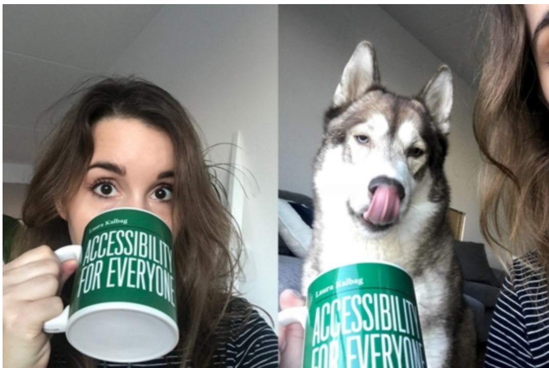
Oskar pense que l'accessibilité du mug c'est pour lui aussi

Mastodon ne sera peut-être pas notre solution optimale définitive en tant que réseau social, mais ce sera peut-être une étape sur le chemin. C'est une véritable alternative à ce qui existe déjà. Nous sommes actuellement bloqués avec des plateformes qui amplifient les problèmes structurels de notre société (racisme, sexisme, homophobie, transphobie) parce que nous n'avons pas d'alternatives. Nous ne pouvons pas échapper à ces plateformes, parce qu'elles sont devenues notre infrastructure sociale.