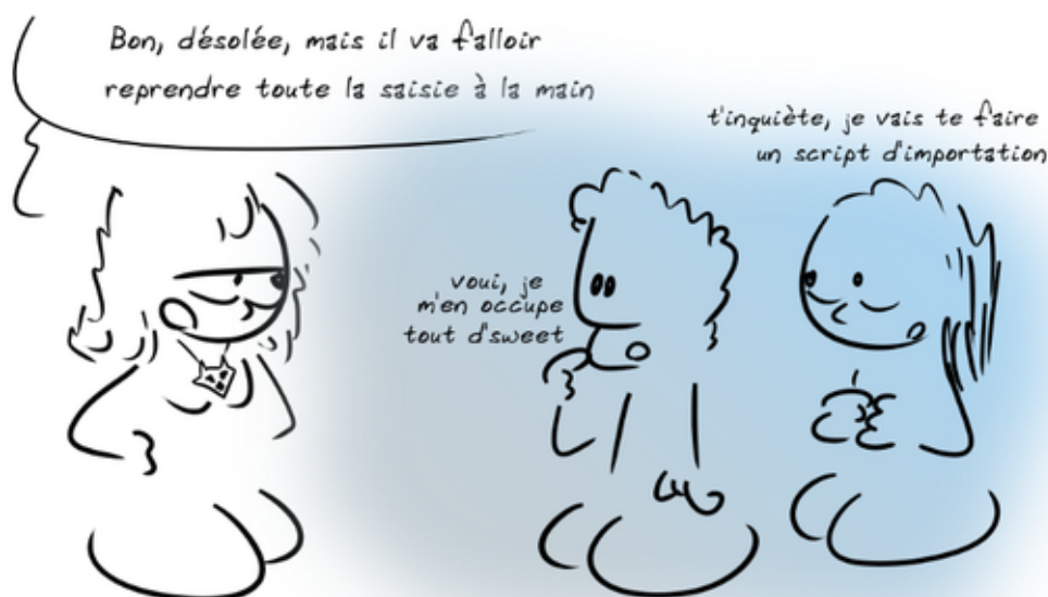
fig.1 Travailler en équipe pour résoudre un problème. La théorie.

En formant l'une des deux bénévoles, on s'aperçoit ensemble que de nombreuses données de l'ancienne base sont erronées depuis quelques mois (suite à une maintenance de M. Calisson) et que ces erreurs ont été (évidemment) reportées sur la nouvelle base. Nous arrivons à une conclusion terrifiante : il faut repasser manuellement derrière chacune des 1275 adhésions à partir des bordereaux d'adhésion, conservés par précaution. Cette opération nous a coûté 4 à 5 heures. La bénévole a eu la gentillesse de m'apporter une pizza pour que je puisse finir mon travail d'esclave le plus vite possible sans sortir du bureau.