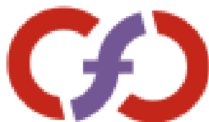
Logo de DLeC

C'est le moment de faire un point d'étape avec le duo et de remercier sincèrement les donateurs et donatrices de Framasoft qui ont permis le financement de cette expérimentation.