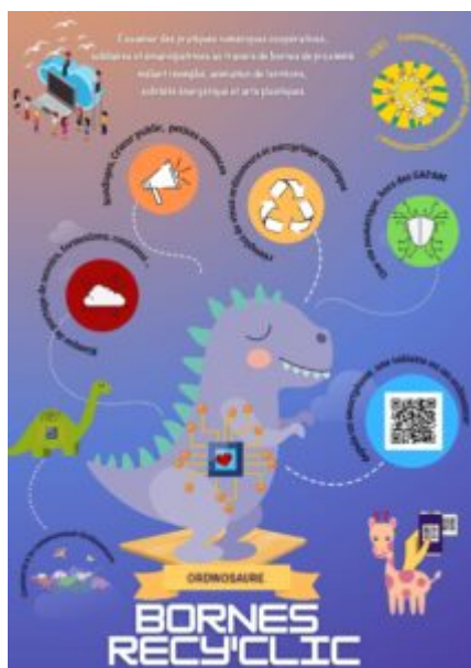
Une affiche de présentation des bornes Recy'clik par Uto de R(d)évolution