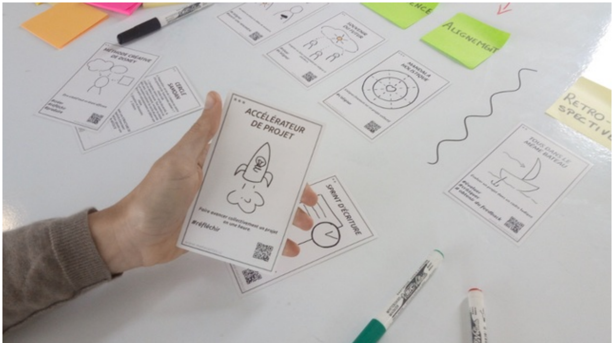
Prototype du jeu de Métacarte « Faire ensemble »