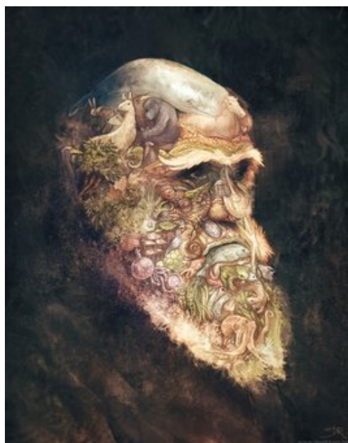
Darwin par David Revoy, extrait

Il ne me reste plus qu'à continuer d'informer les lecteurs et leur demander de soutenir les artistes libres qu'ils aiment directement via Internet et non de penser que ces artistes touchent un quelconque gros pourcentage opaque sur les produits dérivés que ceux-ci iront acheter. Cette tâche d'information, si on s'y mettait tous collectivement et pratiquement entre artistes, aurait certainement plus d'effets sur nos niveaux et confort de vie que toutes négociations de pourcentages et discussions de frais d'avances autour de réunions et de cocktails.