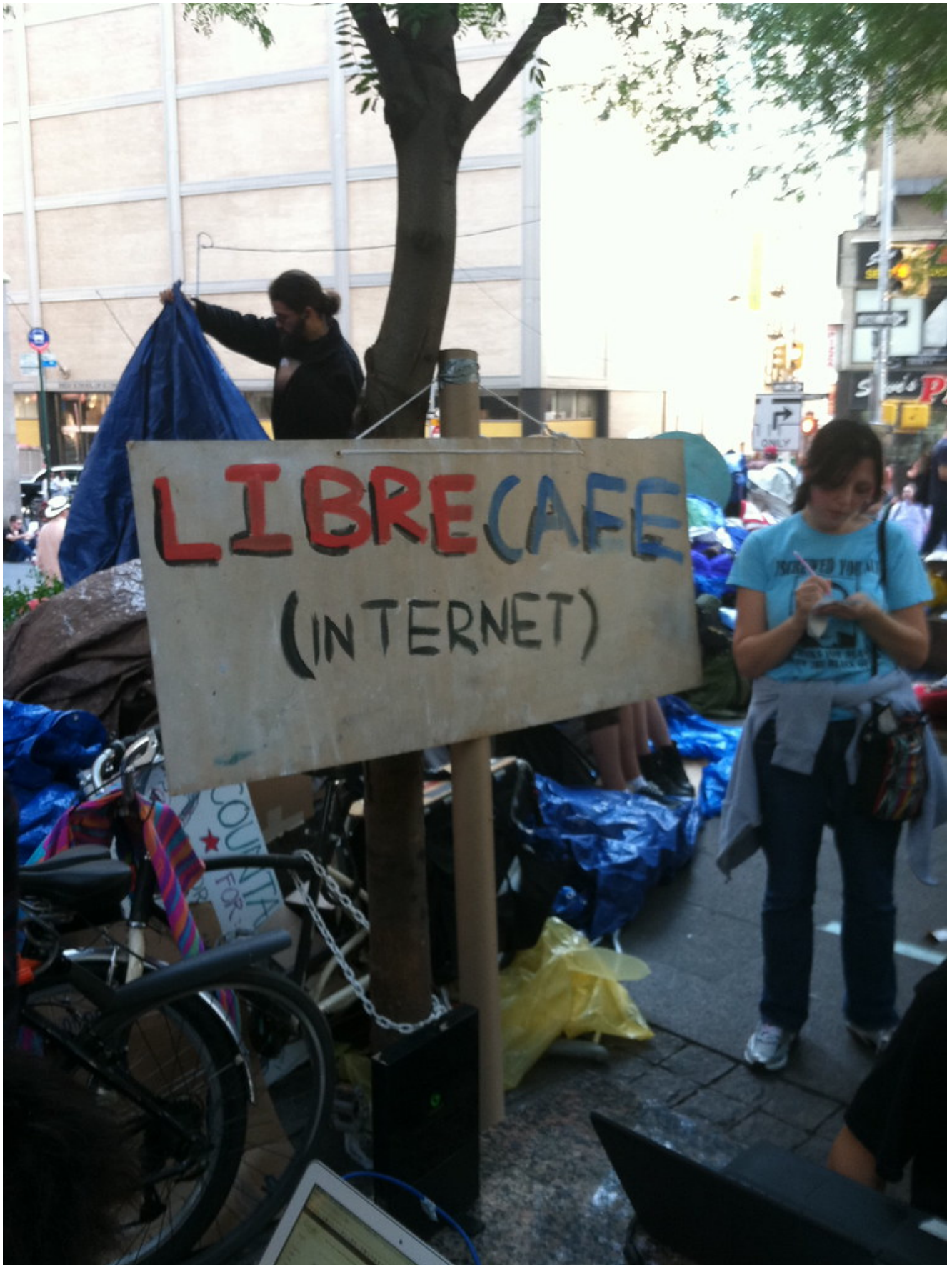
« Occupy Wall Street » par Talk Media News Archived Galleries, licence CC BY-NC-SA 2.0