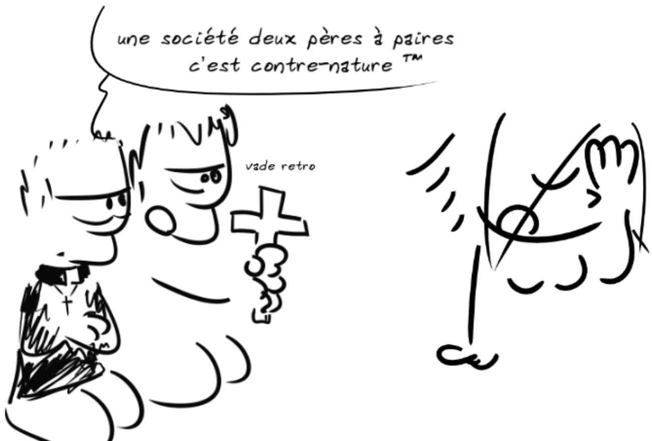
Illustration réalisée avec https://framalab.org/gknd-creator/