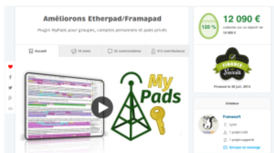
Campagne MyPads sur Ulule

NB : fidèles à ses principes, l'équipe a répondu en mode collectif, au nom de Bearstech dans son ensemble, et bien évidemment sur... un pad géré par MyPads ! ☐