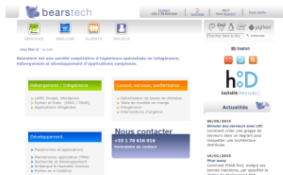
capture écran du site Bearstech.com

On peut rajouter à nos spécificités le télétravail : même si quelques irréductibles se rendent au bureau, les 2/3 sont en télétravail et qui plus est répartis dans la France entière (dont un nomade). On organise un grand raout chaque année pour se retrouver, mais on peut aussi se faire de temps en temps petits regroupements régionaux où se retrouver à Paris à l'occasion.