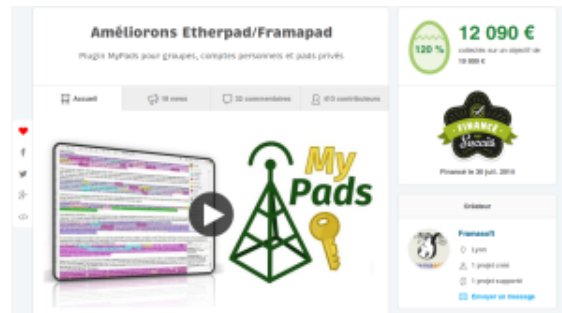
Campagne MyPads sur Ulule