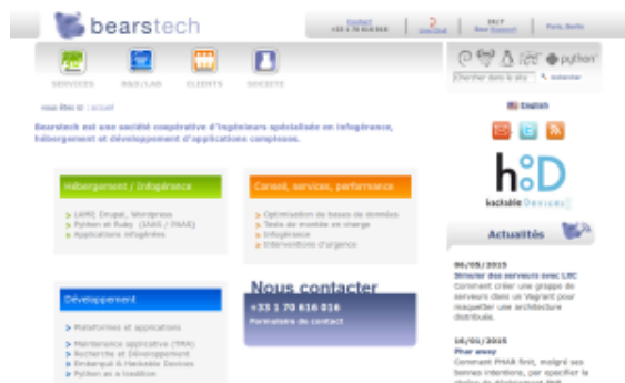
capture écran du site Bearstech.com

On peut rajouter à nos spécificités le télétravail : même si quelques irréductibles se rendent au bureau, les 2/3 sont en télétravail et qui plus est répartis dans la France entière (dont un nomade). On organise un grand raout chaque année pour se retrouver, mais on peut aussi se faire de temps en temps petits regroupements régionaux où se retrouver à Paris à l'occasion.