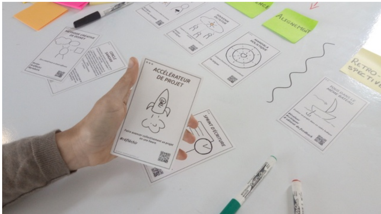
Prototype du jeu de Métacarte « Faire ensemble »