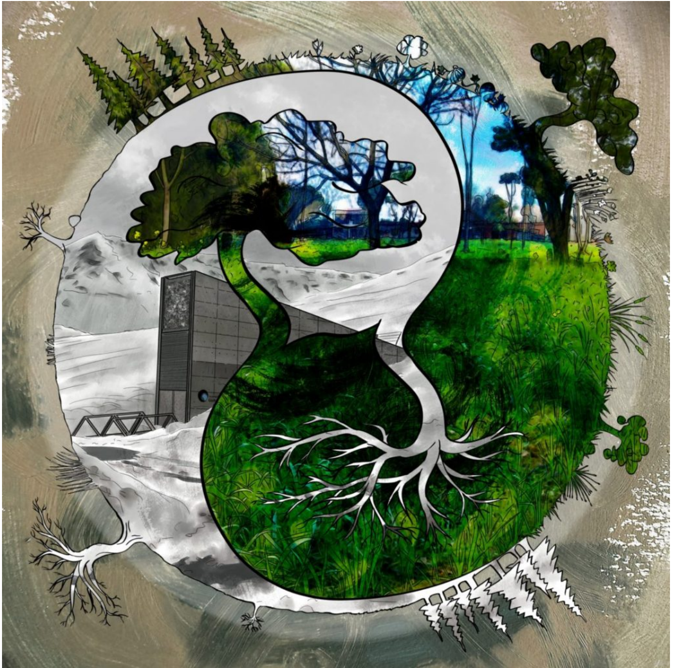
Yin-Yang seed - Œuvre de Nylnook, CC-BY-SA

dessins), en essayant de réaliser des plants chez soi et/ou en participant à la petite communauté qui débute autour de ce site.