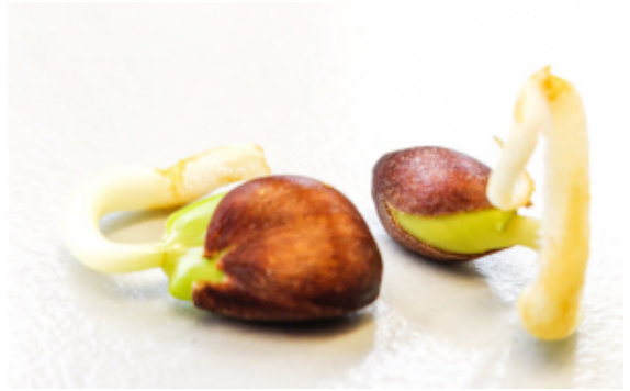
Germination de pépins de pomme

Mais si nous sommes nombreux à faire ces petits gestes, imagine la quantité d'arbres que nous pourrions produire.