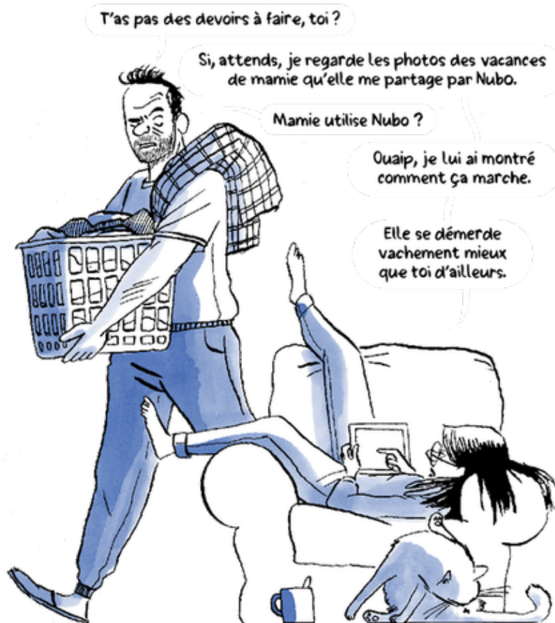
Illustration de Lucie Castel

Il manque encore 10 000 euros pour arriver à l'objectif mais ça avance plutôt vite. Une date de lancement à nous communiquer ?