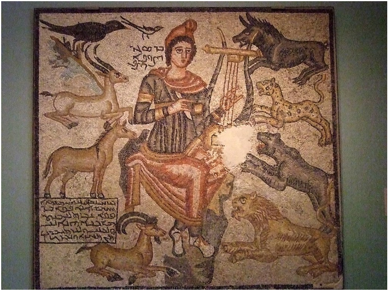
Mosaïque romaine, Orphée apprivoisant les animaux