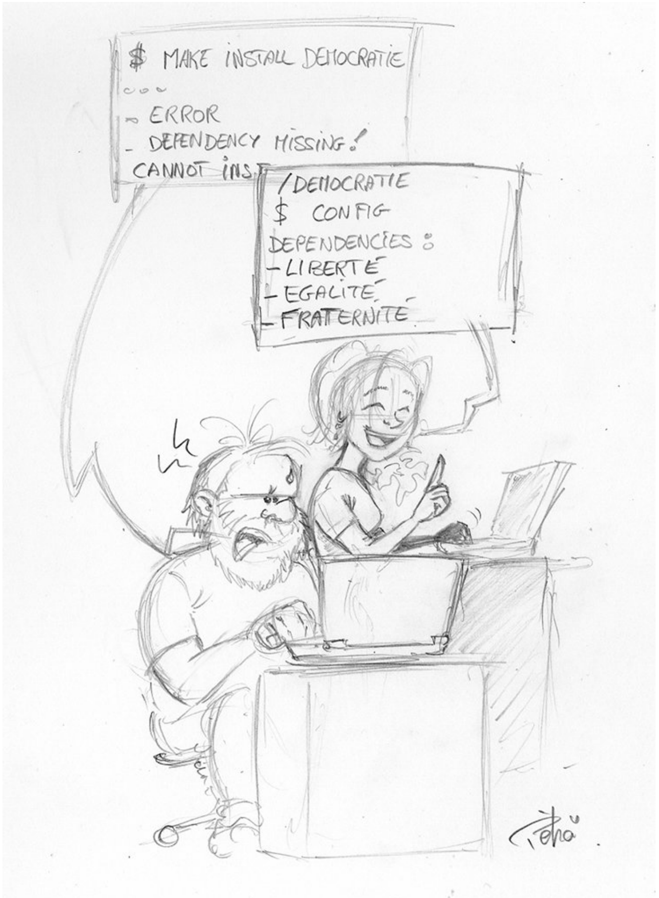
En exclusivité pour les lecteurs du Framablog, un crayonné d'une partie de l'affiche pour l'Espace du logiciel libre, des hackers et des fablabs de la fête de l'Huma par Pehä.