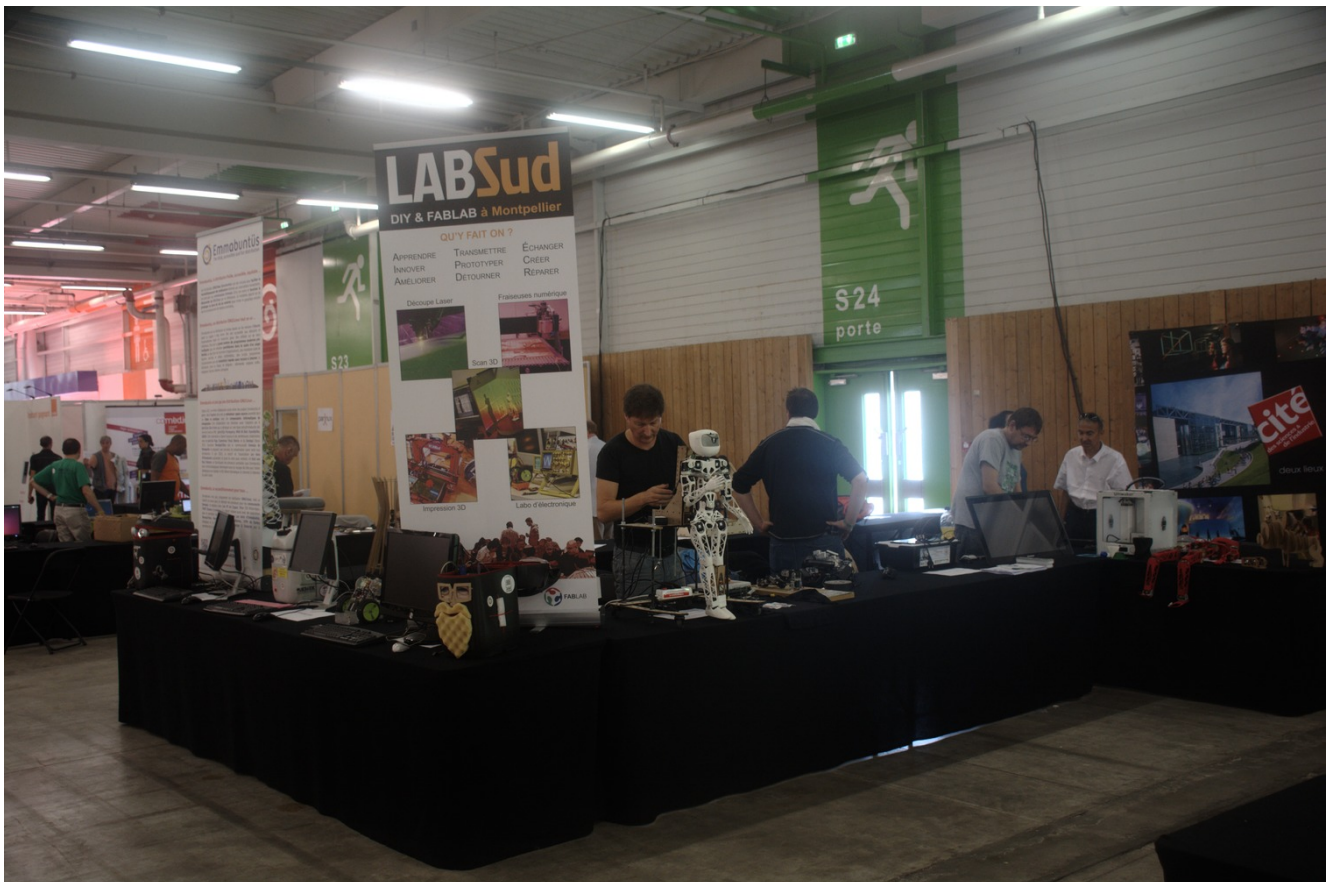
L'espace Logiciel Libre / Hackers / Fablabs de la fête de l'Huma 2015